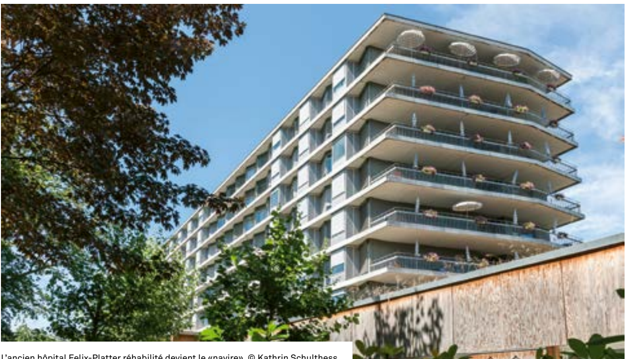
L'ancien hôpital Felix-Platter réhabilité devient le «navire».

Le classement de ce bâtiment emblématique fut une étape décisive qui ouvrait la voie pour la planification de 530 logements sur les 36 000 m 2 du site de l'hôpital Felix-Platter, rebaptisé Westfeld. La coopérative wohnen&mehr, fondée en 2015, se voit alors confier la gestion de l'ensemble. Elle s'engage pour la durabilité dans les domaines économique, social