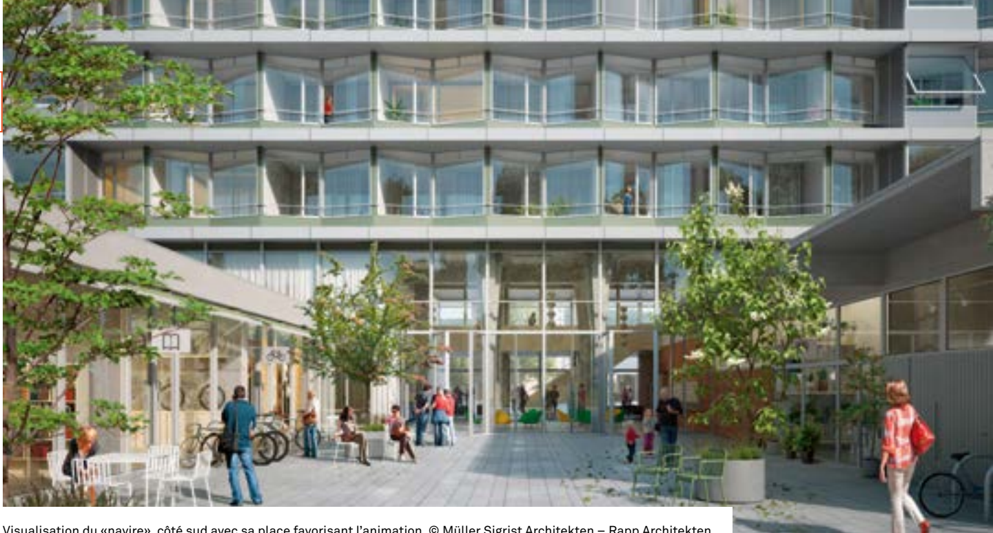
Visualisation du «navire», côté sud avec sa place favorisant l'animation. © Müller Sigrist Architekten – Rapp Architekten

et environnemental dans la ville et ses quartiers. Elle promeut notamment des logements attractifs, abordables pour tous, favorise la mixité sociale par l'intégration de populations de provenance et d'âge diversifiés. Elle veut expérimenter de nouvelles formes d'habitat et de places de travail, et encourage une culture du bâti de qualité, dans un cadre de vie attrayant.