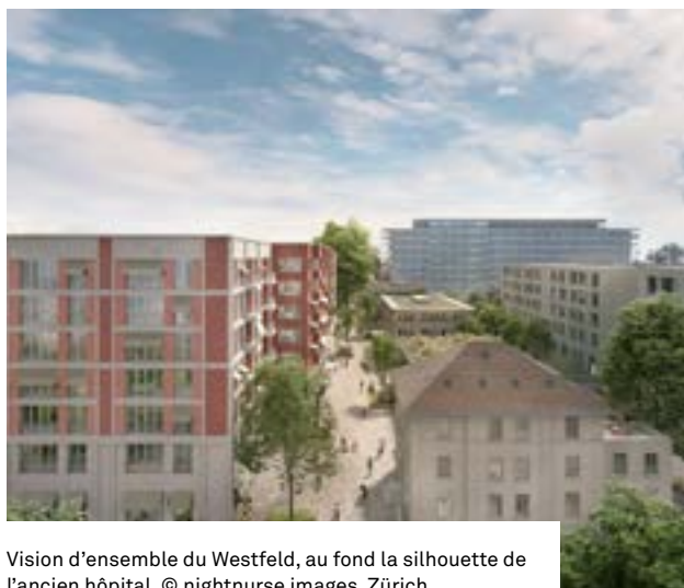
Vision d'ensemble du Westfeld, au fond la silhouette de l'ancien hôpital.

D'un point de vue énergétique, wohnen&mehr s'appuie sur les objectifs de la société à 2000 watts, notamment par des installations photovoltaïques. Elle recourt à des matériaux de construction respectueux de l'environnement, comme du béton recyclé partout où la statique le permet. La mobilité douce est encouragée, le quartier étant très bien relié aux transports publics et un réseau de services et de magasins de proximité se développe. Une grande importance est accordée aux aménagements extérieurs: une ceinture verte, des jardins avec jeux pour toutes les générations, des toitures et façades végétalisées, la plantation de nombreux arbres en font un quartier en pleine verdure, adapté à la lutte contre le réchauffement climatique et profitant aux habitants pour se ressourcer et se dépenser. Des projets pour favoriser la biodiversité, comme les martinets noirs et les abeilles, sont aussi prévus. D'un point de vue social, la variété de taille et de forme des logements, du studio au cluster de sept pièces et demi, en passant par des duplex, et des espaces communs, entendent